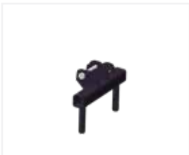
Rasengitter 1 Lage