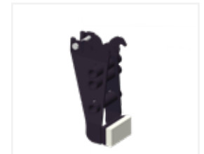
Gummibacke 30 cm tief