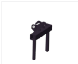
Rasengitter 2 Lagen