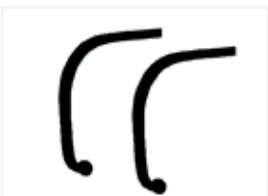
2 Anschlagbügel (inkl.)