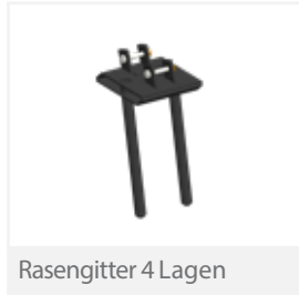
Rasengitter 4 Lagen