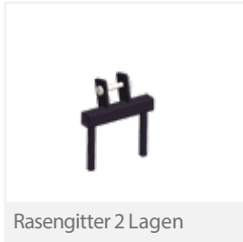
Rasengitter 2 Lagen