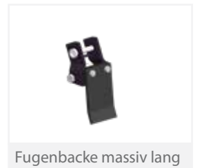
Fugenacke massiv lang