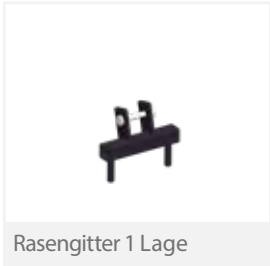
Rasengitter 1 Lage