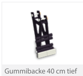
Gummiacke 40 cm tief