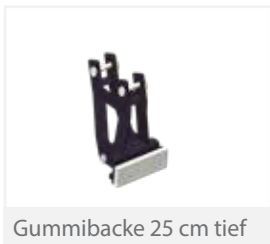
Gummiacke 25 cm tief