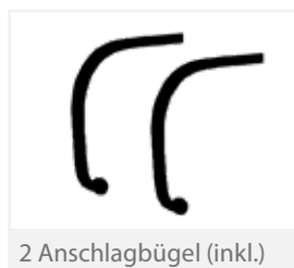
2 Anschlagbügel (inkl.)