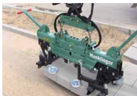
Großpflaster mit S400