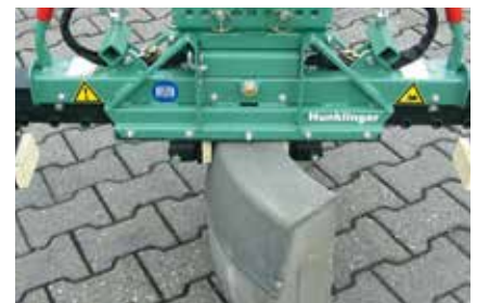
Quergreifen Radiensteine setzen oder Borde aufnehmen