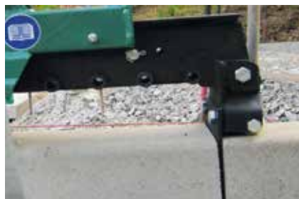
Präzise ansetzen Greifbacke ermöglicht sauberes Anlegen