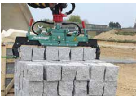
Rinnensteine mit S100