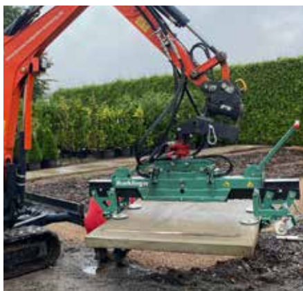
Große Platte mit S400