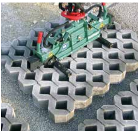
Rasengittersteine mit S100