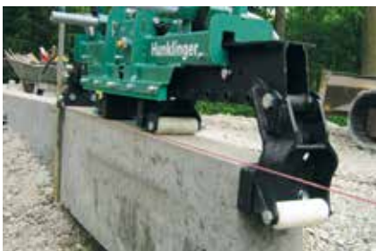
An Schnur anlegen Längsgreifen erlaubt genaues Setzen