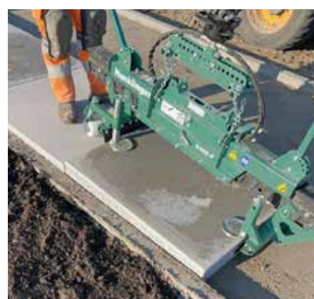
Platte 100 x 100 cm mit S400