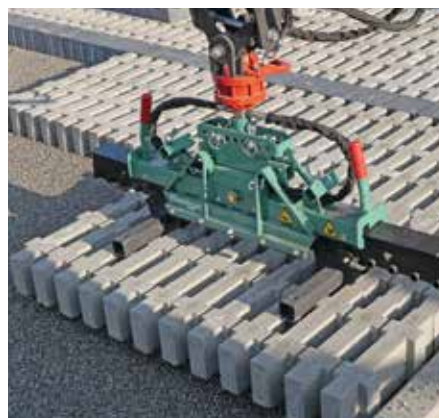
Hartrasenplatten mit S100