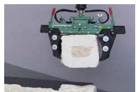
Natursteine mit S100