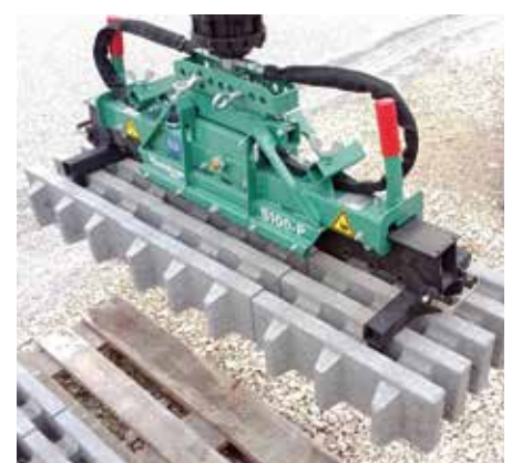
Rasenliner mit S100